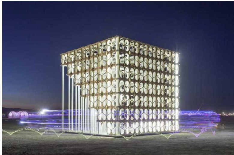
Renaixement de Pink Intruder.

Continúa mañana sábado 16 con un recorrido que tendrá como punto de encuentro el CTAV y comenzará con una visita comentada a la exposición 'La falla i la plaça', acompañada de un pequeño almuerzo.