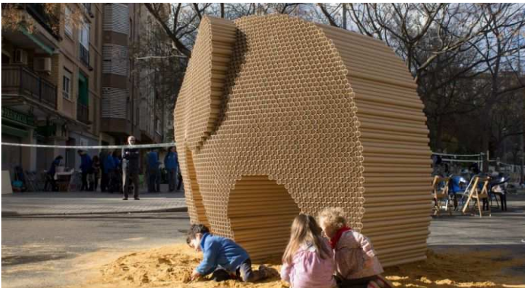
Falla Somnis de Pes. Fotografía de Nicola Murer

Tras el éxito de la edición en 2018 del Colegio Territorial de Arquitectos de Valencia (CTAV) Arquitecturas para el fuego ( https://www.arquitecturayempresa.es/noticia/arquitecturas-para-el-fuego ), el pasado 13 de marzo de 2019, se inauguró en la Sala de Exposiciones del CTAV, la exposición La falla i la plaça (La falla y la plaza) comisariada por Rafael Rivera ( http://www.rsrarquitectes.com/rsrarquitectes_estudio_equipo_rafael%20rivera.html ), que centra la relación entre el monumento fallero y sus calles y plazas.