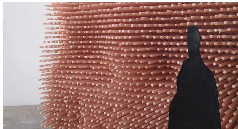
Falla Fer i desfer, maqueta de la propuesta, Nituniyo y Menosesmas