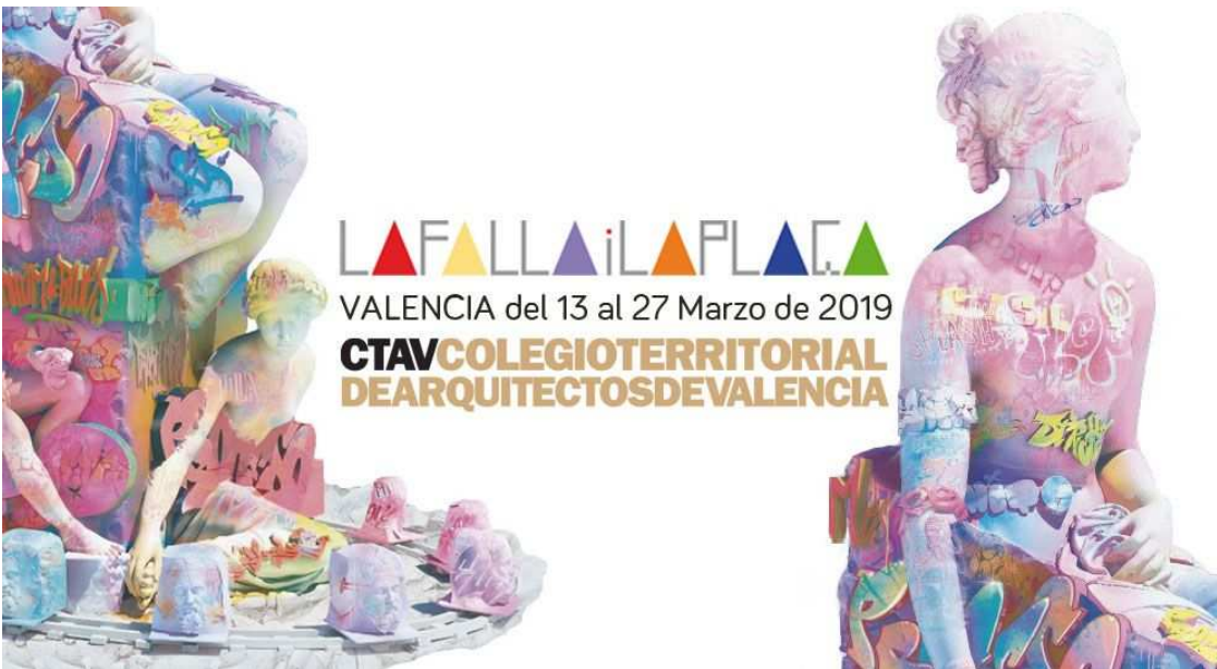
La falla i la plaça

Desde el pasado 13 al 27 de marzo de 2019, el CTAV organiza esta exposición comisariada por el arquitecto y urbanista Rafael Rivera