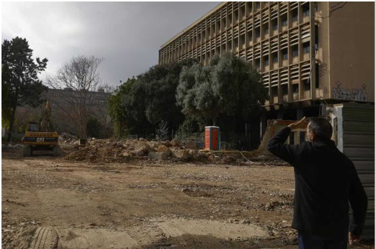
Aspecto de las obras de ampliación del Hospital Clínico. iván arlandis

El Colegio defiende que debía haberse mantenido el conjunto de la obra de Moreno Barberá y no demoler una parte para ampliar el Clínico