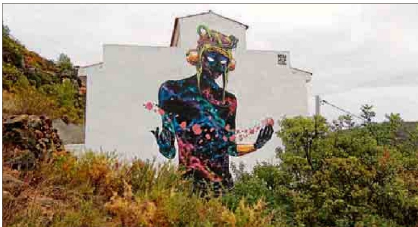
Una obra de DEIH en la pared exterior de una vivienda.

El tutor de la segunda salida, el 19 de febrero, será el reconocido Deih ( www.eldeih.com ), cuya obra se ha podido ver en museos y galerías como el Muvim, Museu del Centre del Carme, Sala Josep Renau (UPV), UNAM (Mexico D.F.), Avart, Crewest Gallery (L.A.), The Fridge (Washington D.C.) y en