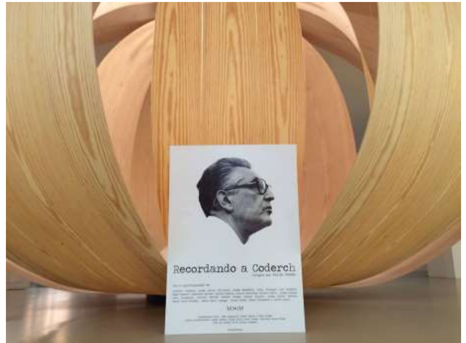
Arriba, un interior típicamente coderquiano recreado en la exposición. Abajo, una reproducción a gran escala de la lámpara que diseñó Coderch.