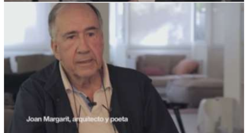
Fotogramas del documental Recordando a Coderch .