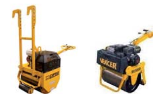
Rodillo compactador vibrante.