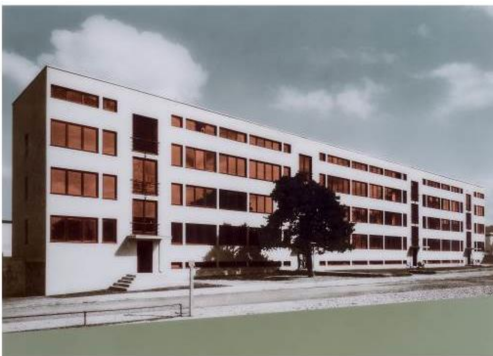
W.H.S. 02, 2002. Thomas Ruff. IVAM. Depósito Cal Cego