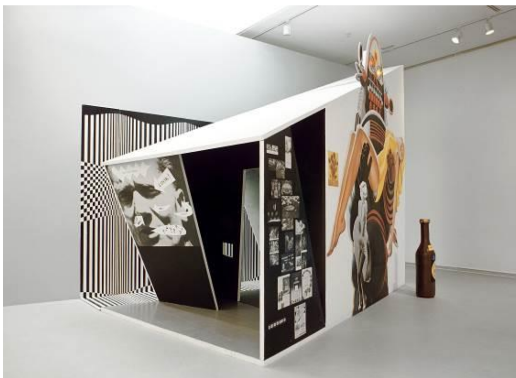
Fun House , 1956. Richard Hamilton. IVAM

A través de este extenso recorrido, que incluye fragmentos de películas como Alphaville , 1965, de Jean-Luc Godard , Skyscraper Symphonie , 1929, de Robert Florey ; In the Street , 1948, de Helen Levitt ; Empire , 1964, de Andy Warhol ; Splitting , 1970, de Gordon Matta Clark y Broadway by Light , 1958, de William Klein , pasamos de una gran celebración de las metrópolis, en el que la ciudad era la más clara manifestación de la modernidad, al desencanto que se materializa en la expresión de los miedos, la soledad, el control o la vigilancia.