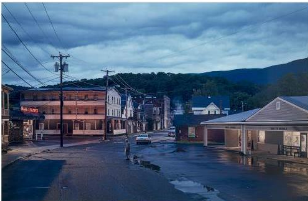
Untitled (Oasis) , 2004. Gregory Crewdson. IVAM. Depósito Cal Cego

Artistas como Anzo (1931-2006) y Juana Francés (1924-1990) y, posteriormente, Juan Muñoz (1953-2001), desarrollan trabajos reflexivos y críticos respecto a la condición existencial del ser humano frente al progreso industrial y tecnológico. En su obra Aislamiento , 1967, Anzo hace hincapié en la pérdida de sentido y de identidad de la persona descontextualizándolo, representándolo como un asceta en perfecta comunión con la mecanización, la industrialización y la vida en las oficinas. Juana Francés produce su serie El hombre y la ciudad , 1963, describiendo un entorno angustioso y agobiante, dominado por la incomunicación, la alienación y la continua transformación del hombre en máquina. Los personajes monocromos de rasgos impersonales de Juan Muñoz , como la escultura Chino frotándose las manos , 1995, analizan el aislamiento y la carencia de comunicación.