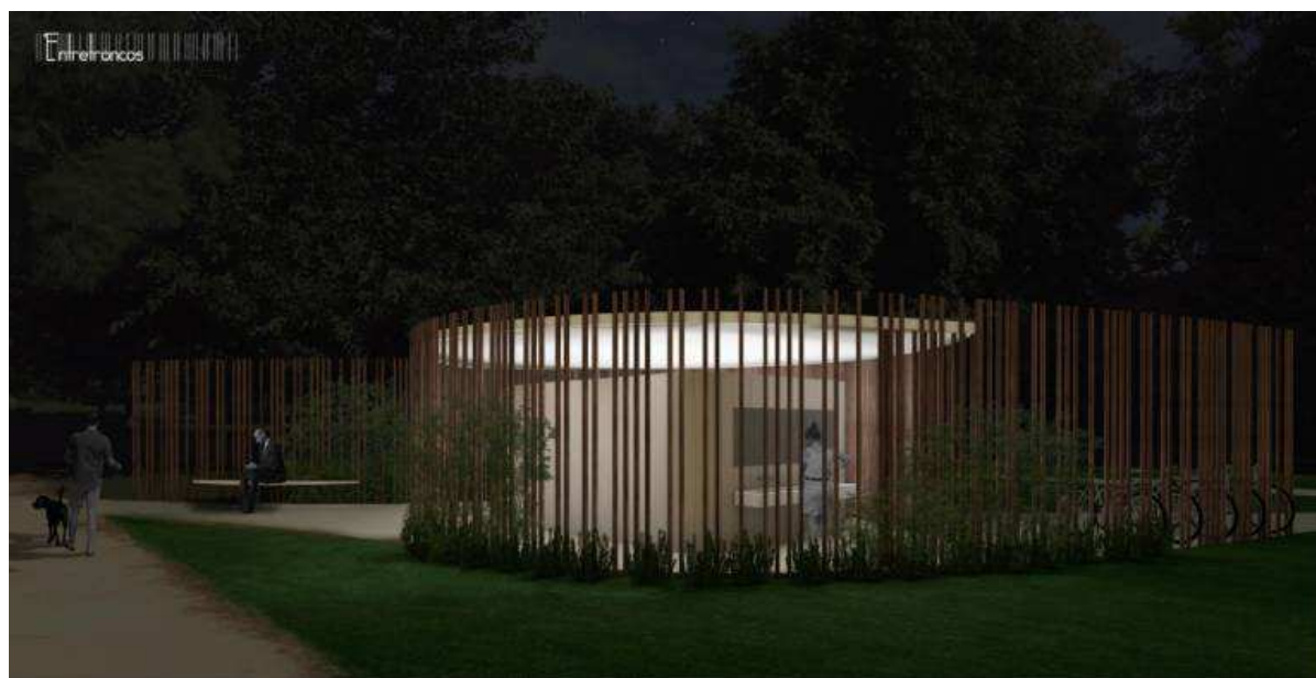
Recreación del proyecto ganador.

20/11/2018 - VALÈNCIA. Era una de las demandas ciudadans en los Presupuestos Participativos de 2018: el Jardín del Túria necesita nuevos baños. Una idea que pronto tendrá su reflejo sobre el terreno el próximo año. Este martes se presentó el proyecto de las cuatro nuevas instalaciones de diseño que el consistorio construirá en el antiguo cauce del río.