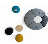
MESA CAFÉ AUXILIAR