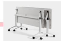
BUTACA LONGO NOMADA