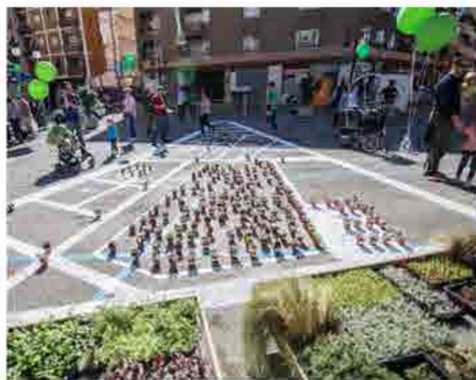
1, 7, 10. El botànic es mou. Procés participatiu sobre espai públic i mobilitat pel barri Botànic. La palatgeria. València, 2017