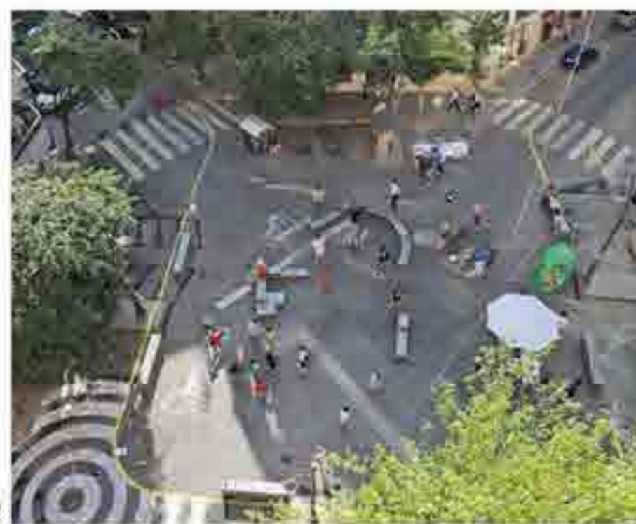
3, 6, 12. Acció i projecte d'apropiació de plaça de l'Eixample PAH PHE MC. EFGarquitectura. València, 2014