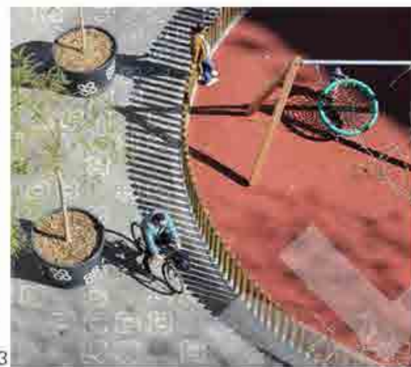
4, 5, 11. Superilla de Poblenou. Àrea d'Ecologia, Urbanisme i Mobilitat. Ajuntament de Barcelona. Barcelona, 2017