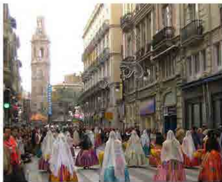
2, 8, 9. Apropiació de l'espai públic en diferents moments de la festa de Falles