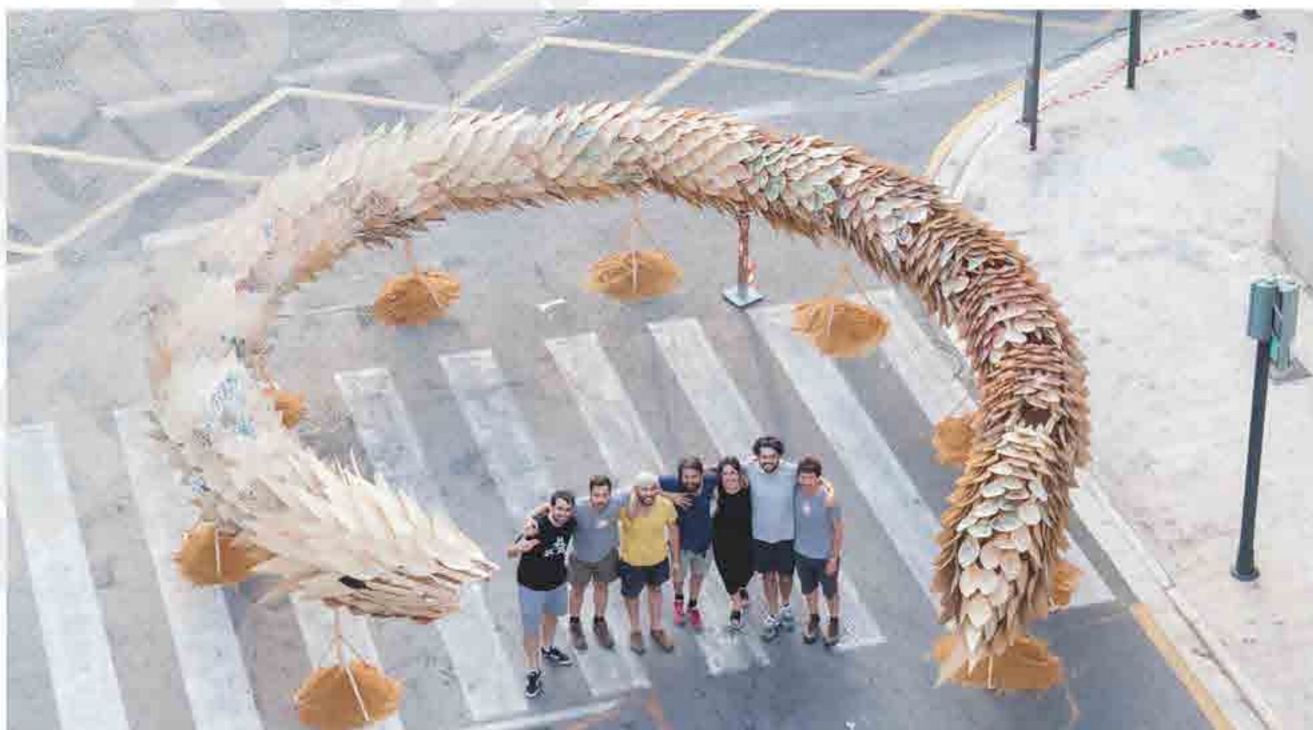
Fotografía: Milena Viliaba