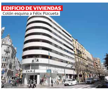
EDIFICIO DE VIVIENDAS Colón esquina a Félix Pizcueta

Otros ojos. El itinerario refresca la mirada hacia la Valencia que conocemos y la Valencia pendiente siempre de ser descubierta, rescata joyas antiguas e ilumina otras recientes. Incluso revive hallazgos como el parque en el cauce del Turia. Porque el urbanismo también es arquitectura. Y la arquitectura moderna, ambas cosas: moderna y arquitectura. Gran arquitectura