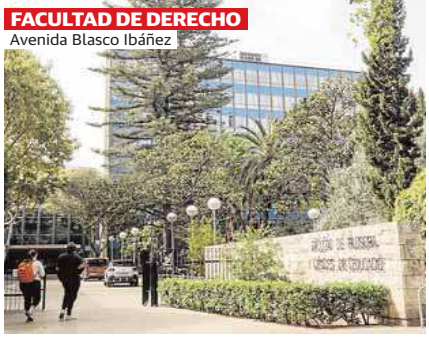
FACULTAD DE DERECHO Avenida Blasco Ibáñez

Uno de mis edificios favoritos de Valencia del siglo XX es la antigua fábrica de Carlos Gens, ubicada en el barrio de Marxalenes y conocida popularmente como Bombas Gens. Se dedicaba a la fabricación de pequeña maquinaria agrícola, válvulas industriales y bombas hidráulicas. Construida en los años 30, con un magnífico diseño en sus fachadas principales con estilo Art Decó y una cuidada distribución interior para contener la producción de esta fundición. Se trata de un conjunto de grandes valores históricos y arquitectónicos, un gran ejemplo de patrimonio industrial valenciano y también un ejemplo de elemento dinamizador del entorno por la gestión actual que está teniendo con los nuevos usos que tiene, como centro de arte y sede de la Fundación Per Amor a l'Art, entre otros.