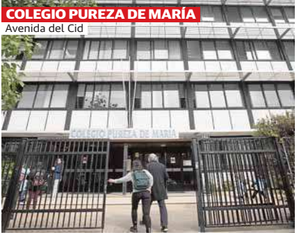
COLEGIO PUREZA DE MARÍA Avenida del Cid

Modernista, expresionista o moderna, la ciudad es testigo de su tiempo y así quiero destacar un ejemplo reciente pero menos conocido: las viviendas de realajo en el barrio del Carmen. Me parece relevante poner el acento en grandes arquitectos en ejercicio, en la vivienda, entendida como una cuestión social, y en una arquitectura surgida de su contexto, que seguramente pase desapercibida pero que se sustenta simultáneamente en la tradición mediterránea y en su reinterpretación contemporánea cultural y técnica. Esta pequeña intervención permite disfrutar de una sugerente solución en esquina donde la abstracción de los huecos, los espacios intermedios, la luz y la sombra construyen un imaginario atemporal, sostenible y socialmente comprometido, en el que nos podremos sentir siempre identificados.