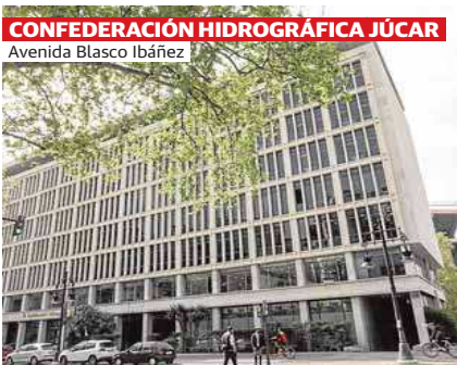
CONFEDERACIÓN HIDROGRÁFICA JÚCAR Avenida Blasco Ibáñez

Siempre me ha interesado la arquitectura anónima, el trabajo bien hecho y en silencio. Veo mi ciudad, Valencia, llena de ejemplos de esa arquitectura desconocida, proyectada por arquitectos anónimos (y no tanto). Edificios, plazas y calles diseñados con el único interés de servir a los demás. Un ejemplo: el conjunto de viviendas sociales junto a la calle Arquitecto Guastavino, en el barrio del Cañameral. Siete bloques ortogonales de arquitectura desnuda. Construidos al final de los años sesenta, para dar cobijo a las familias de trabajadores portuarios. Siete bloques ordenados como barracones, que dejan entre sí pequeñas calles sin salida, convertidas en patios de vecinos. Cuando los visito, paseo por allí como un voyeur y miro sus pequeños balcones. Espejos de lo que pasa dentro, un Instagram analógico de quien los habita.