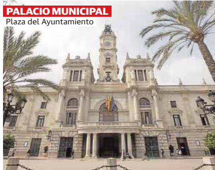
PALACIO MUNICIPAL Plaza del Ayuntamiento

Distribuido para AGUA Y SAL COMUNICACION * Este artículo no puede distribuirse sin el consentimiento expreso del dueño de los derechos de autor.