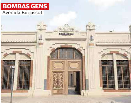
BOMBAS GENS Avenida Burjassot

Una construcción cargada de elementos de fuerte modernidad: su estructura de hormigón visto de esquinas achaflanadas y un excelente cuidado en su ejecución, que aporta ritmo y orden a sus coloradas fachadas azul y naranja. La mayoría de las 138 viviendas construidas en dos bloques de 12 pisos son dúplex con escalera interior, aunque hay otras de una planta en el bloque pequeño y en planta baja. El conjunto se articula con espacios abiertos interiores, lo que lo aleja de las habituales edificaciones entre medianeras del Ensanche. Se mantiene inalterable su esquema constituyendo en sí un modo de vida particular: en planta inferior la cocina y el salón-comedor con balcón, arriba las habitaciones. Destaca la concepción de los espacios compartidos: pasillos y escaleras aireados por celosías y el patio con alberca y arbolado.