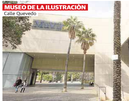
MUSEO DE LA ILUSTRACIÓN Calle Quevedo

El antiguo cauce del río Turia es uno de los lugares favoritos para pasear, hacer deporte y estar en contacto con la naturaleza. Con el paso de los años este corredor verde se ha enriquecido con arquitecturas, paisajes y esculturas. Los puentes adquieren un simbolismo especial, son puntos de encuentro y forman parte del imaginario colectivo que los ha hecho propios, dotándolos de nuevos significados y denominaciones. Obra de Santiago Calatrava, el 9 de octubre sorprende por su escala humana. Su doble tablero es ideal para el tráfico rodado, mientras que desde el lecho fluvial la escenografía escultórica de hormigón visto genera un ambiente de enorme confort visual. La materialidad, los soportes metálicos, contrafuertes y voladizos consagran una puesta en escena mágica y orgánica que favorece la estancia creativa.