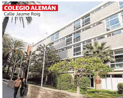
COLEGIO ALEMÁN Calle Jaime Roig