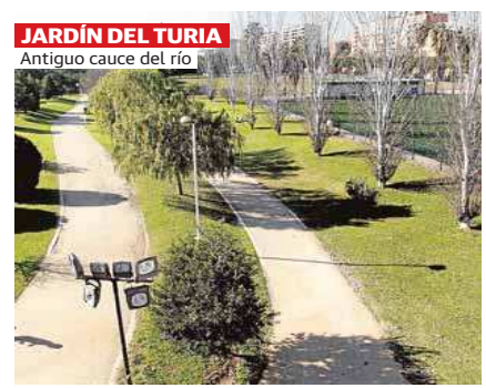
JARDÍN DEL TURIA Antiguo cauce del río

Cada vez que doblo la esquina de plaza de América me cautiva el vidrio redondeado que abraza el magnífico zaguán del edificio de viviendas de GODB, construido, aunque cueste creerlo por la actualidad de sus elegantes líneas, hace ya más de 50 años. Desde la libertad que ofrecía la ausencia de reglas tan estrictas de construcción como las que ahora nos asfixian por la vigencia de un obsoleto plan de ordenación urbana y el miedo inquisidor de los responsables de su urbanismo, se alza un edificio grácil e inteligente, y tan innovador en sus planteamientos constructivos como modélico en su factura. Capaz de navegar con gracia entre las exigencias estéticas de cada generación, regalan a sus afortunados moradores espacios abiertos y unas magníficas vistas, y todo aderezado con el cálido acompañamiento de la madera.