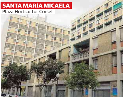
SANTA MARÍA MICAELA Plaza Horticultor Corset

Distribuido para AGUA Y SAL COMUNICACION * Este artículo no puede distribuirse sin el consentimiento expreso del dueño de los derechos de autor.