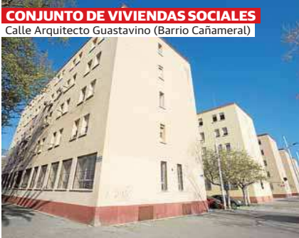
CONJUNTO DE VIVIENDAS SOCIALES Calle Arquitecto Guastavino (Barrio Cañameral)

Distribuido para AGUA Y SAL COMUNICACION * Este artículo no puede distribuirse sin el consentimiento expreso del dueño de los derechos de autor.