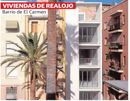
VIVIENDAS DE REALAJO Barrio de El Carmen