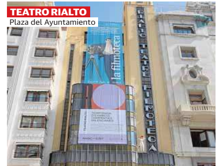
TEATRO RIALTO Plaza del Ayuntamiento