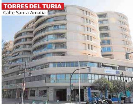
TORRES DEL TURIA Calle Santa Amalia

Distribuido para AGUA Y SAL COMUNICACION * Este artículo no puede distribuirse sin el consentimiento expreso del dueño de los derechos de autor.