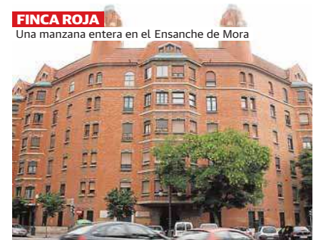
FINCA ROJA Una manzana entera en el Ensanche de Mora