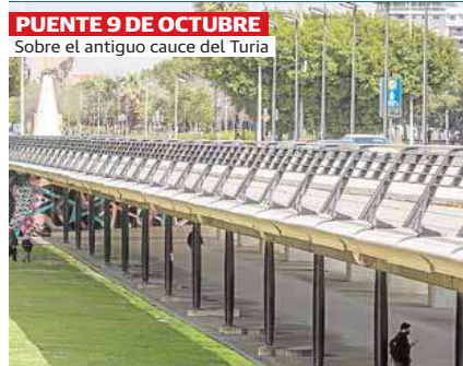
PUENTE 9 DE OCTUBRE Sobre el antiguo cauce del Turia

Mi infancia se desarrolla en el emergente barrio de Monteolivete, entre los 60-70, zona precursora de la actual filosofía de ciudad de los 15 minutos. Todo a unos pasos, auténtica vida de barrio. Dentro de aquella cotidianeidad, la parroquia de Jesús Maestro, bella y minimalista, evoca los principios vitruvianos: 'firmitas' (resistencia), 'utilitas' (función) y 'venustas' (belleza). Obra de Corrales y Molezún, su integración urbanística desde su mediana con la finca vecina, a la que adosa la torre campanario, hasta el escalonamiento hacia las antiguas vías del tren... En su interior, el altar ocupa un lugar central, flanqueado por columnas de hormigón, bancadas a los lados y el celebrante oficiando hacia la simbólica luz lateral procedente de las vidrieras. Al exterior, un caravista aparejado protagoniza una fachada carente de huecos.