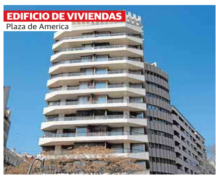
EDIFICIO DE VIVIENDAS Plaza de América