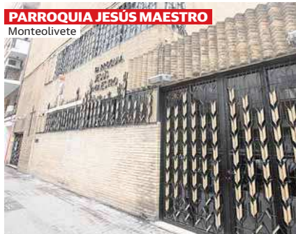
PARROQUIA JESÚS MAESTRO Monteolivete

El Palacio Municipal simboliza el buen gobierno. Joya de la mejor arquitectura ecléctica e imponente icono urbano, repleto de historia y con extraordinarios fondos documentales. La fachada noble, de impecable simetría a la plaza, se asoma a la escena cívica con una volumetría ciclópea cuya axialidad define una elevada torre del reloj rematada por un carrillón metálico con campanas. Con un lenguaje neorrenacentista, de extraordinaria ornamentación barroca, genera un privilegiado palacio de la vida cultural y social. El conjunto escultórico conforma un rico imaginario mármreo; en su interior, las piezas más emblemáticas proyectadas por Mora y Carbonell exhiben una lujosa decoración: mármoles italianos, bronce dorados, maderas tropicales, tapizados, vidriería... Una arquitectura sofisticada, una majestuosa escenografía.