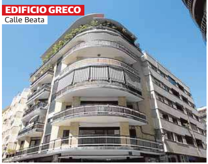
EDIFICIO GRECO Calle Beata

Moreno Barberá fue un gran arquitecto del Movimiento Moderno, estilo internacional cuyo objetivo era mejorar la sociedad con la arquitectura y el urbanismo mediante el funcionalismo. Se asignaba un tratamiento arquitectónico específico a cada uso del edificio, siendo Derecho muestra pionera, de excepcional valor patrimonial. La arquitectura anterior eran monovolúmenes con fachadas similares y decoradas. De repente, los edificios se diseñan en bloques de diversos tamaños cuyo destino es reconocible desde el exterior. De la manzana cerrada se pasa a la 'edificación abierta y la ciudad moderna, con edificaciones rodeadas de espacios ajardinados. Se imponían los nuevos materiales, como el hormigón visto en vigas, pilares y parasoles de las fachadas del aula. O el acero de la fachada acristalada del bloque de seminarios.