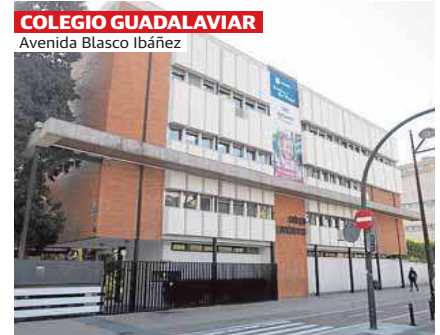
COLEGIO GUADALAVIAR Avenida Blasco Ibáñez

El Museo Valenciano de la Ilustración y la Modernidad destaca por ser diferente, diseñado en el más puro estilo minimalista. Un monolito de hormigón que alberga un fantástico museo de ideas, que no de objetos, homenaje a la revolución intelectual y política que supuso la Ilustración en el XVIII. Ordena el entorno existente, sirviendo de fondo al jardín del Antiguo Hospital, con el que entabla un diálogo permanente a través del hueco y la marquesina del acceso principal, y de sus grandes ventanales, especialmente el del vestíbulo general con su elevada altura, articulando los dos volúmenes lineales principales que conforman el edificio, entrelazados entre sí como una cinta Moebius. Obra de Guillermo Vázquez Consuegra, recibió en 2001 el Premio CEOE al mejor edificio de España.