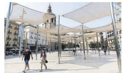
De izquierda a derecha: Iglesia de San Juan del Hospital (siglo XIII), el edificio Cortina (1901) y las intervenciones en la Plaza de la Reina (Escario y José María Tomás) y la Plaça del Mercat (Elisabet Quintana y Blanca Peñín).