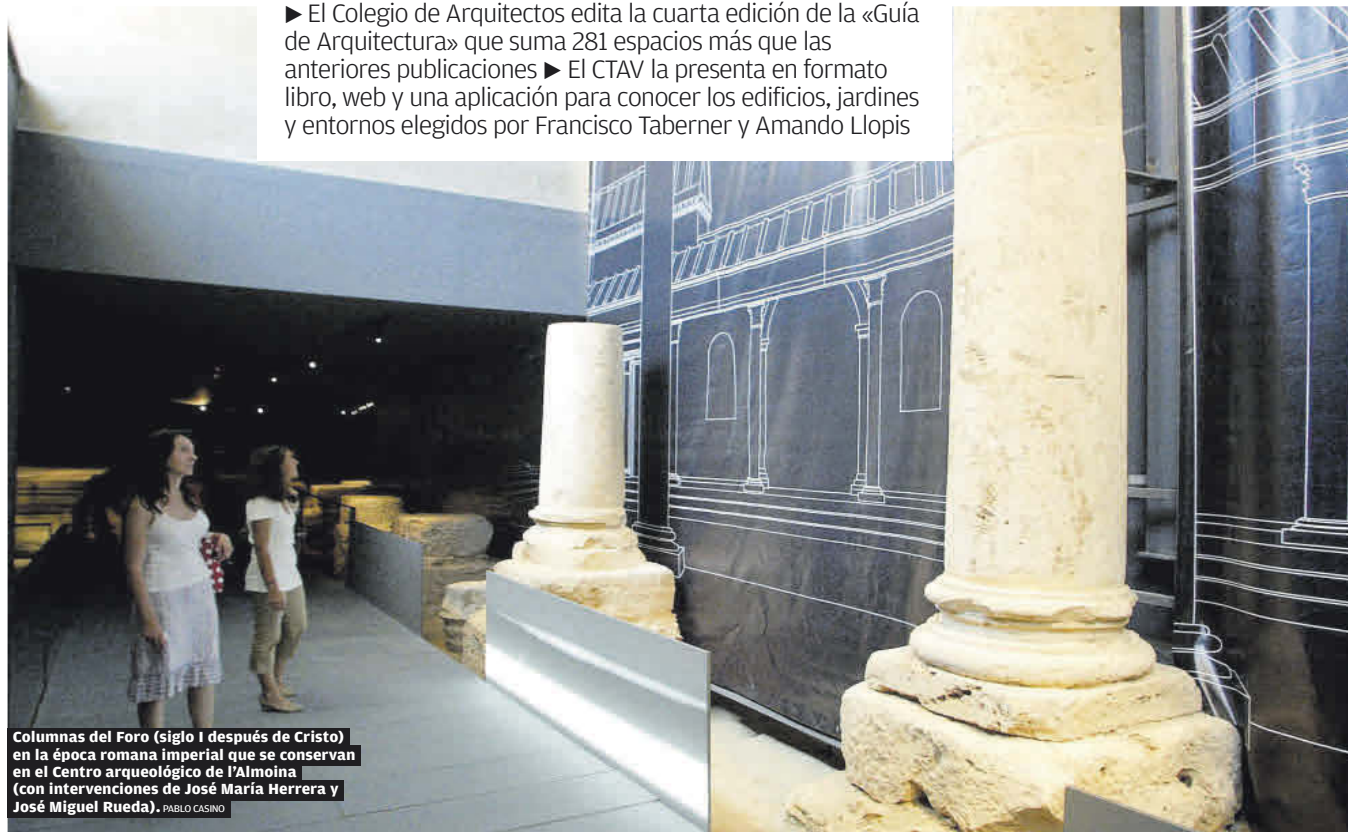
Columnas del Foro (siglo I después de Cristo) en la época romana imperial que se conservan en el Centro arqueológico de l'Almoína (con intervenciones de José María Herrera y José Miguel Rueda). PABLO CASINO

► El Colegio de Arquitectos edita la cuarta edición de la «Guía de Arquitectura» que suma 281 espacios más que las anteriores publicaciones ► El CTAV la presenta en formato libro, web y una aplicación para conocer los edificios, jardines y entornos elegidos por Francisco Taberner y Amando Llopis